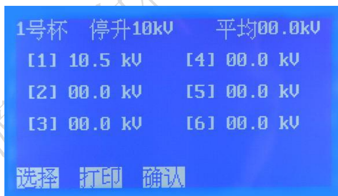
图 7. 显示子页面

7. 每次击穿电压值和轮回次数自动存储，测量完毕后显示测试完毕，然后按 确认 键返回到开机页面（图 1），按 打印 或 显示 键进入油杯每次击穿电压值和平均值的存储记录（图 7）