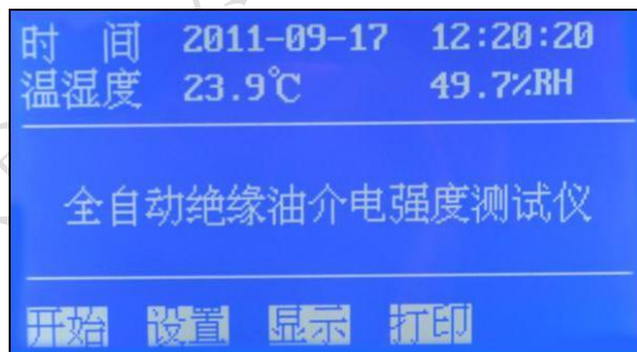
图 1. 开机页面