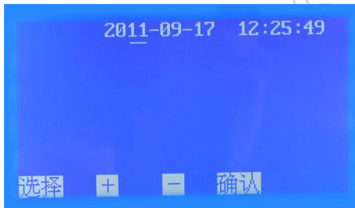
图 5. 时间设置子页面

5. 在图 2 页面下，按 选择 键移动光标 √ 至时间设置处，按 确认 键即可进入时间设置子页面（图 5）