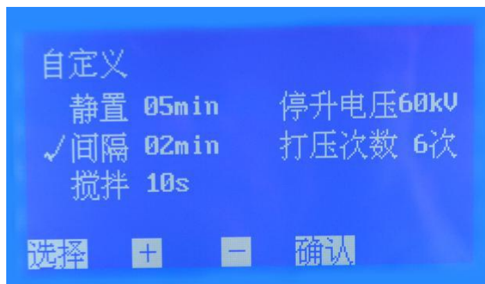
图 6. 自定义设置子页面

在图 6 页面下，按 选择 键移动光标到相应的选项，再按 + 或 - 键可进行相关参数的设置。其中：