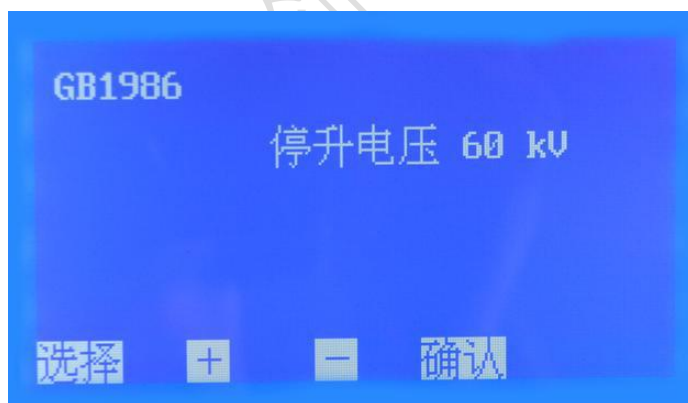
图 3. GB1986 子页面

在图 3 页面下，按 + 或 - 键设置 停升电压 ，其默认值是 80 kV，可选范围 10 kV~80 kV（档位增量 10 kV）。选择好后按 确认 键返回开机页面，按 开始 键进行测试。