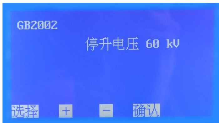
图 4. GB2002 子页面

在图 4 页面下，按 + 或 - 键设置 停升电压 ，其默认值是 80 kV，可选范围 10 kV~80 kV（档位增量 10 kV）。选择好后按 确认 键返回开机页面，按 开始 键进行测试。